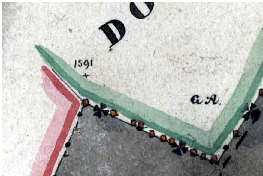
Ilustracja 59: Fragment wykonanej w 1840 roku mapy katastralnej „Dorf Ober Andersbach böhmisch Anderspach Hořeny...”, [11]. W bezpośrednim sąsiedztwie zachowanych do dziś charakterystycznych załamania granicy widoczne są napisy „1591” oraz „CA” (bądź też „GA”).

mapie katastralnej. Ponieważ w latach 1576-1609 krzeszowskim opatem był „Kaspar II. Ebert” 105 , a imię Kacper po łacinie zapisywane jest w formie „Casper” 106 , toteż litery „CA” mogłyby oznaczać „Casper Abbas”, czyli znak graniczny ustawiony za czasów opata Kacpra.