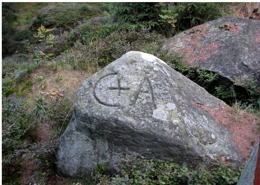
Ilustracja 58: Kamień graniczny z wykutymi literami „C+A”. Fotografia: Marian Gabrowski, wrzesień 2008.

Warto zwrócić tu uwagę na fakt, że opisywany kamień znajduje się dokładnie na granicy miejscowości Uniemyśl i Adršpach. Prawdopodobnie tenże właśnie kamień graniczny przedstawiony jest też na mapie katastralnej z 1840 roku 104 , gdzie w interesującej mnie lokalizacji ukazane są litery „CA” (bądź też „GA” - być może tak właśnie niegdyś odczytano znaki „C+A?”); litery te znajdują się w pewnej odległości od cyfr tworzących datę „1591”.