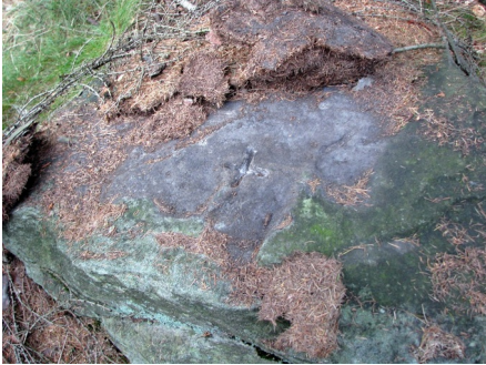
Ilustracja 56: Znak „+” wykuty na granicy miejscowości Uniemyśl i Adršpach, czyli na granicy polsko-czeskiej.

Martwiec (lub czeski Mrtvy vrch ) to szczyt w Zaworach, leżący niemal dokładnie na granicy polsko-czeskiej. „Słownik geografii turystycznej Sudetów” w opisie Martwca wspomina: „Pod szczytem Martwca zachował się stary kamień graniczny. Nieregularny blok posiada wykute litery »C+A«, będące najprawdopodobniej oznaczeniem granic posiadłości opactwa krzeszowskiego” 103 .